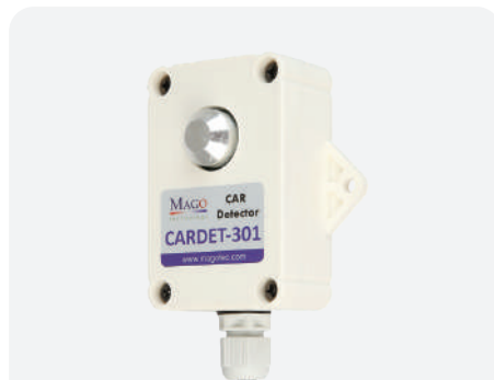
CARDET-301S는 특허 받은 신기술인 Feedback Stabilizing 자기센서와 디지털 적분형 근접센서를 사용하는 계수전용 첨단 디지털 차량 감지센서입니다.

V-COUNTER는 다양한 국내 주차장의 상황에 맞는 여러가지 모드를 내장하고 있어서, 간단한 내부 스위치 셋팅의 변화 만으로 해당 주차장에 맞는 모드를 전환하여 설치가 가능합니다.